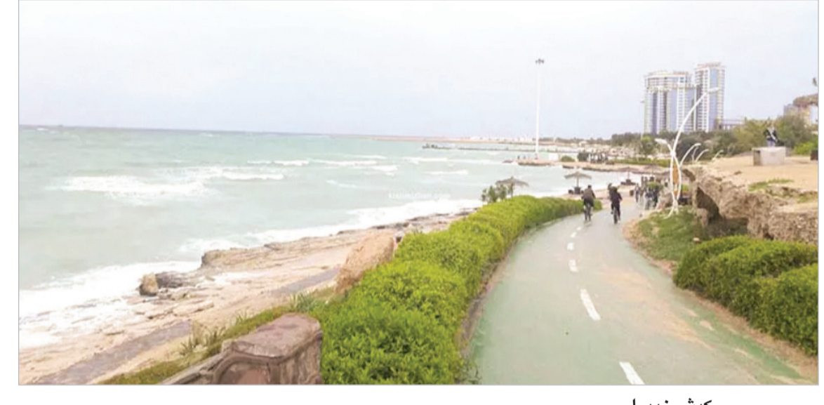
عکس روز کیش زیبا