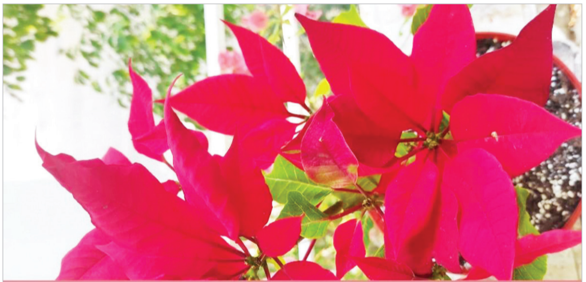
اشرف زابلی - کیشوند