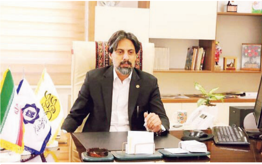
دبیر کمیته ملی گردشگری سبزه مطرح کرد: