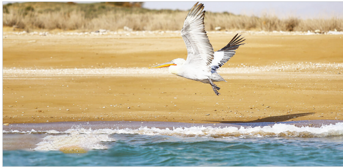
جزیره مارو - هرمزگان