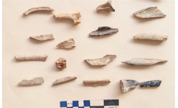
گروه گردشگری - تپه‌های باستانی در استان فارس پیدا شده که زیر موزاییک‌ها و بتن یک پارک محلی دفن است در حالی که احتمال دارد کشفیات