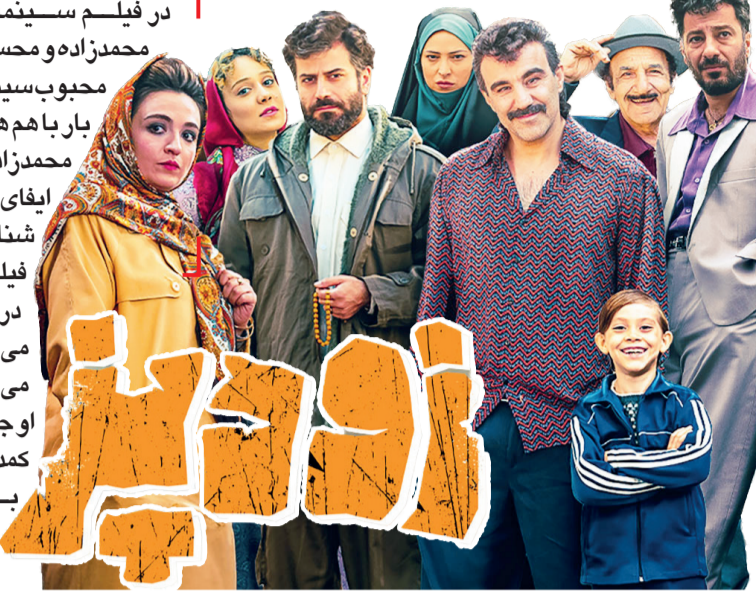
در سالروز میلاد شاعر اتاقی آبی بررسی کرد:

در فیلم سینمایی «زودپز»، نوید محمدزاده و محسن تائبنده، دو بازیگر محبوب سینمای ایران برای اولین بار با هم همکاری می‌کنند. نوید محمدزاده که بیشتر برای ایفای نقش‌های دراماتیک شناخته می‌شود، در این فیلم برای نخستین بار در ژانر کمدی بازی می‌کند. این تغییر نقش می‌تواند برای طرفداران او جذاب باشد، چرا که کمدی‌های رامبد جوان به سبک خاص و شوخ‌طبعی متفاوتی شناخته شده‌اند.