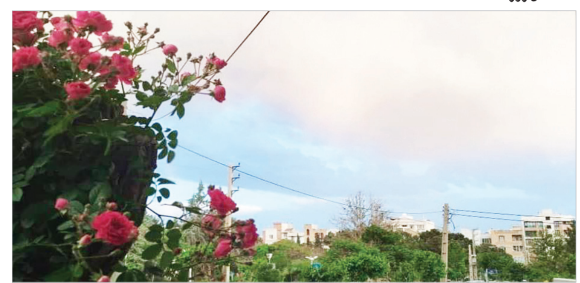
اشرف زابلی - کیشوند