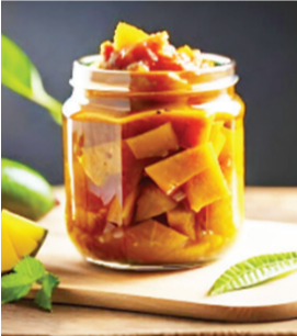
هیچک تهیه می‌شود.

انبه‌ها را پوست گرفته و خلال کنید. به انبه‌های خلال شده مقداری نمک و زردچوبه و فلفل بزنید. اجزاء دهید که انبه‌ها ۱۲ ساعت در محیط بیرون از یخچال استراحت کنند. انبه‌ها را درون بیشه ریخته و لابلای آن ادویه ترشی بزنید. به شیشه انبه، سرکه را اضافه کرده تاروی انبه‌ها را بگیرد. در ظرف را محکم بسته و به مدت یک هفته جای گرم قرار دهید تا ترشی آماده شود. یکی از رازهای خوشمزه شدن ترشی انبه افزودن ادویه ترشی انبه است، این ادویه شامل فلفل سیاه، هل سبز، زیره سبز، دارچین و گل‌هیچک (گلرنگ) است که با نسبت‌های مختلف با هم ترکیب می‌شوند. نوع دیگر این ادویه برای ترشی انبه با ترکیب فلفل قرمز، تخم گشنیز، زازانه، سیاه‌دانه و گل