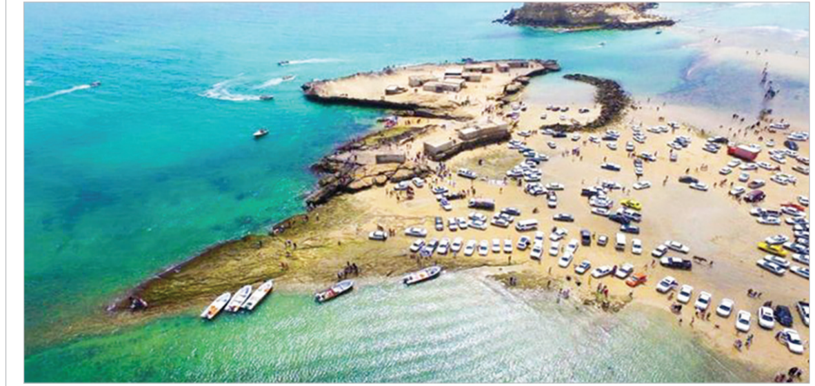
جزایر ناز قشم