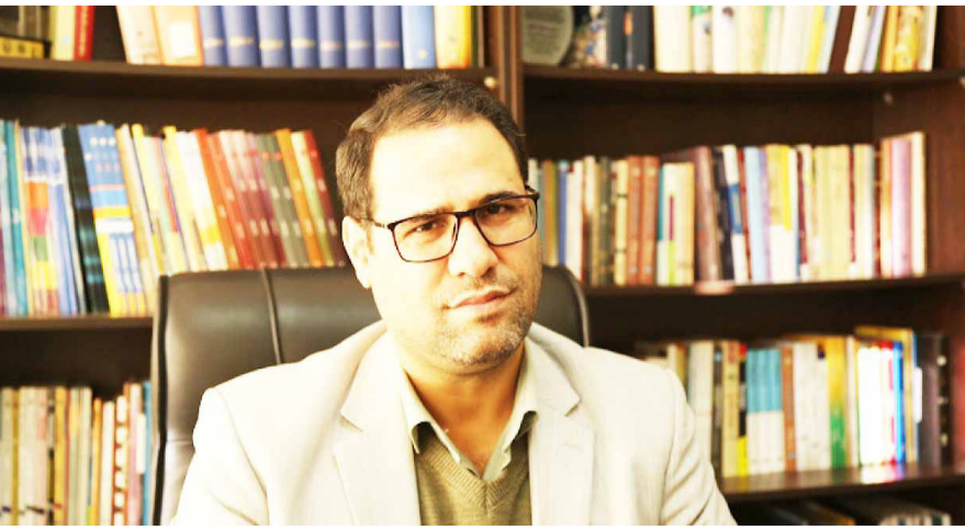
وزیر آموزش و پرورش خبر داد؛

گروه علمی و آموزشی - رضا مراد صحرایی با حضور در مرکز سامد و پاسخگویی نهاد ریاست جمهوری با بیان اینکه حضور در مرکز سامد فاصله را با مردم کم می کند گفت: برای ما افتخاریست ارتباط با مردم بی واسطه باشد تا به عنوان خدمتگذار در خدمت آنها باشیم و به لحاظ توانایی و شرایطی که در اختیارمان است بتوانیم کاری برای آنها انجام دهیم. وی با بیان اینکه باید احترام معلم را نگه داریم افزود: گوهر ملت در دست معلم امانت است. صحرایی گفت: سیمای آینده کشور در آموزش و پرورش شکل می گیرد، کانون خلق آینده هر کشور در آموزش و پرورش است. وزیر آموزش و پرورش در پاسخ به دانشجوی معلمی که درباره ابطال کسر ۴۵ درصد از حقوق دانشجو معلم سوال کرد، گفت: رای دیوان شیوه گرفتن را ابطال کرده است؛ مصوبه مربوط به سال ۹۱ است که براساس قانون متعدین خدمت گفتم است ۴۵ درصد برای ارائه خدمات رفاهی کسر شود و همین موضوع باعث شده به دانشگاه فرهنگیان به اندازه سایر دانشگاهها بودجه ندهند. وی با بیان اینکه وقتی رای به ما ابلاغ شد از استانها خواستیم تا این شیوه کسورات دانشگاه دارند افزود: باید هیئت امنای دانشگاه فرهنگیان تصمیم بگیرد. همچنین به دانشگاه گفتیم به ما جدول ارائه داده و وضعیت کسری از حقوق دانشجو معلمان به ازای وضعیت در دانشجو متفاوت است. صحرایی با بیان اینکه پیوستی که در کنار نامه بنده در فضای مجازی منتشر شده است، از جانب بنده نبوده و مورد تایید نیست ادامه داد: به پلیس فضا گفته ایم این موضوع را پیگیری کند. هیئت امنای دانشگاه فرهنگیان باید رای دیوان عدالت اداری را اجرا کند و هر فردی