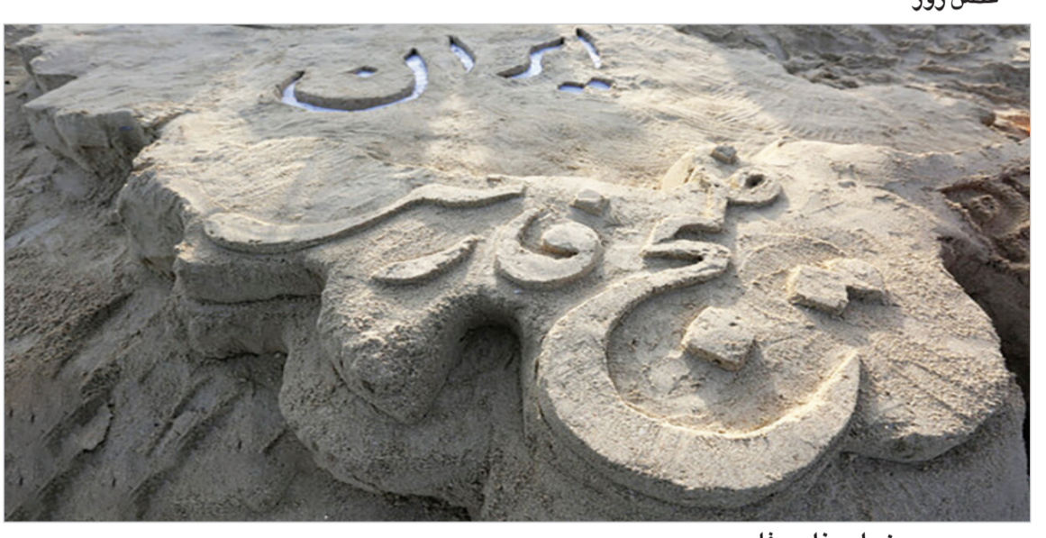
روز ملی خلیج فارس...