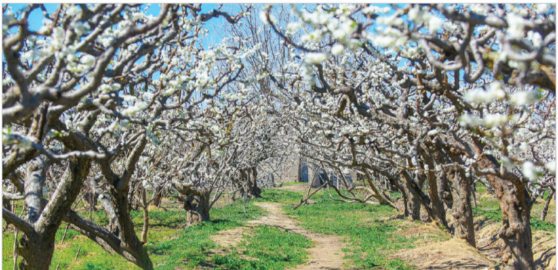
شکوفه های بهاری - نادیا پُرمناه