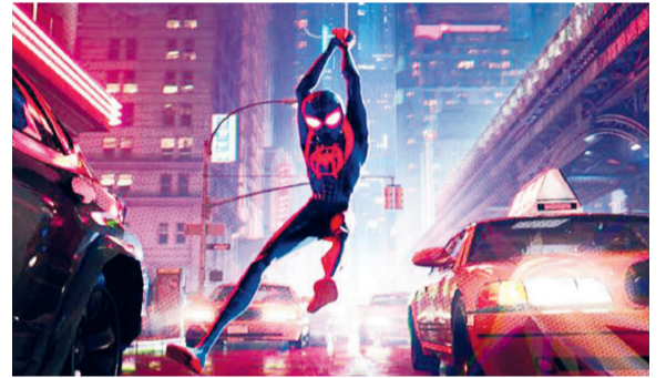
گروه فرهنگ و هنر- «مرد عنکبوتی: در دنبای عتکبوتی» بهترین انیمیشن سال را از جوایز آئی گرفت و «سامورایی چشم آبی» در بخش تلویزیون پیششاند.

فرهنگ ریشه و بنیان یک مملکت است سبب کلیبی با عنوان «علی نصیریان پنجاه سال؛ پنج نقش» از نقش‌های ماندگار سینمایی این استاد پیشکسوت بخش شد. نصیریان در سخنانی اظهارداشت: در زمینه موسیقی، استاد و هنرمندان بزرگی داریم، با این وجود من به سه هنرمند ارادت خاصی دارم. در ابتدا ارادتمند غلامحسین بنان بودم و پس از اینکه محمدرضا شجریان موسیقی اظهارداشت: در زمینه موسیقی، استاد و هنرمندان بزرگی داریم، با این وجود من به سه هنرمند ارادت خاصی دارم. در ابتدا ارادتمند غلامحسین بنان بودم و پس از اینکه محمدرضا شجریان