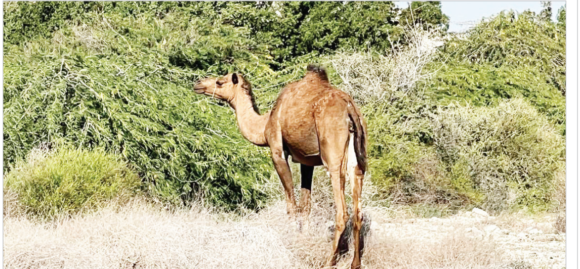
اشرف زابلی - کیشوند