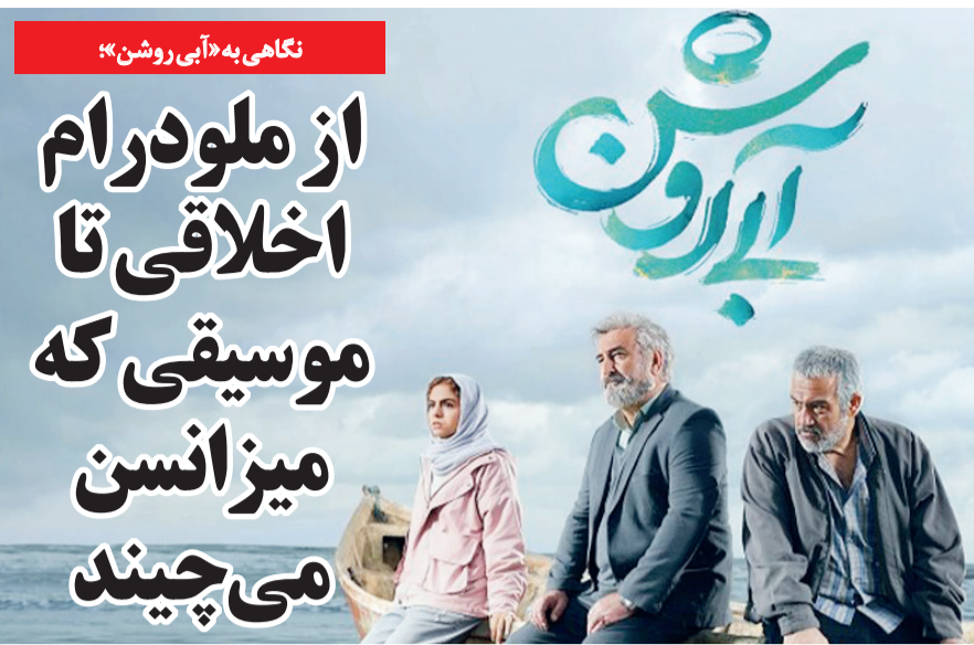
به کارگیری چهار عنصر ژانر ملودرام در فیلم سینمایی «آبی روشن» توانسته به تاثیرگذاری این فیلم روی مخاطب کمک کند.