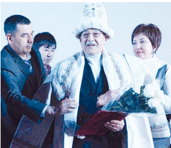
مسکو، لنینگراد، لیتوانی، لتونی، استونی، گرجستان، آذربایجان، اوکراین، مولداوی، ازبکستان، قزاقستان، آلمان، لهستان، چک، رومانی، اتریش، مجارستان، فنلاند، سوئد، کانادا، کاستاریکا، مغولستان و سایر کشورها اجرا شده است. از جمله این نمایشنامه‌ها می‌توان به نمایش معروف «دوتل» وی اشاره کرد. این نویسنده و نمایشنامه نویس قریز همچنین فیلم‌نامه‌های بسیاری از جمله «فرزند پلنگ سفید»، «باران»، «واقع»، «شب سال نو»، «پایتز طلائی» را نوشته و جوایزی را هم از جشنواره‌های سینمایی جهانی و شوروی دریافت کرده است. او همچنین جایزه «ستارگان اتحادیه کشورهای

ا.به فرهنگ کشورش بوده است. رساله‌های دکتری بسیاری تاکنون در خصوص آثار مار باجی‌اف نوشته شده است. مهم‌ترین آثار مار باجی‌اف عبارت‌اند از: «قارا کورت» داستان‌ها (۱۹۶۱)، چپتر، داستان‌ها و حکایت‌ها (۱۹۶۶)، جشن هر خانه (۱۹۸۰)، مسیون امور فرهنگی: اطلاعات؛ زبان ملی و گردشگری پارلمان جمهوری قریزستان خدمت کرده و مدتی نیز رئیس آکادمی سینمای جمهوری قریزستان بوده است. او در نده عنوان «نویسنده برجسته قریزها» و همچنین دارای نشان ماناس است. تدریس در دانشگاه فرهنگ و هنر جمهوری قریزستان از جمله خدمات