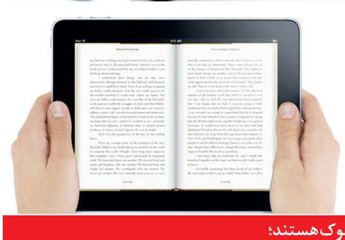
کدام کتاب‌ها ایبوک هستند؟