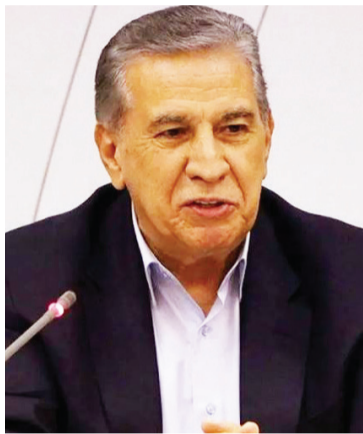
برنامه و بنا دارد از تمام توان خود در اتاق های سراسر کشور برای بالفعل سازی پتانسیل هاستفاده کند.

وی افزود: الحاق ایران به کنوانسیون‌های بین‌المللی سبب می‌شود ریسک مبادلات مالی کاهش یابد و نظام مالی کشور شفاف شود بنابراین از مجمع تشخیص مصلحت‌نظام انتظار داریم گام‌های نهایی برای پیوستن ایران به کنوانسیون‌های پالمو و CFI را بردارد.