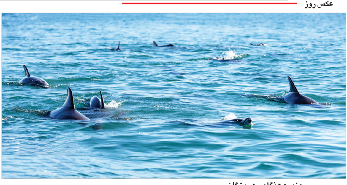
جزیره هنگام - هرمزگان