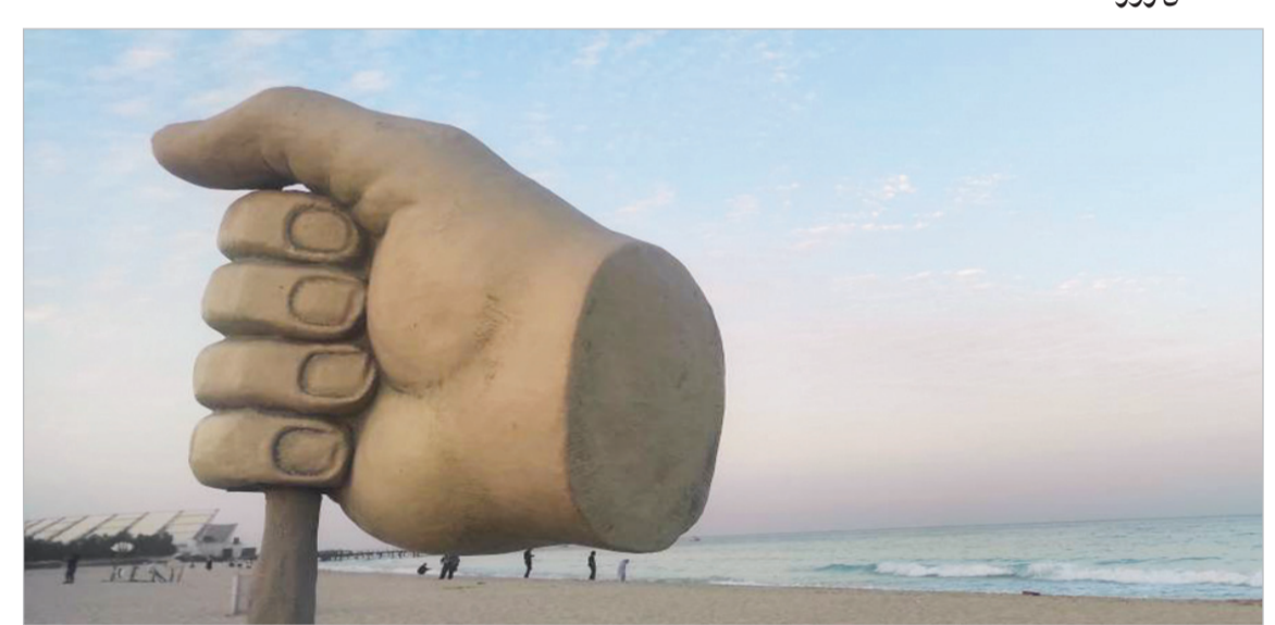
اشرف زابلی - کیشوند