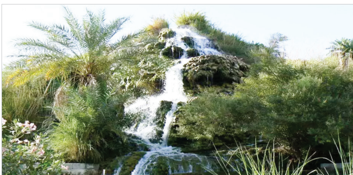
آبشار تزرچ - هرمزگان