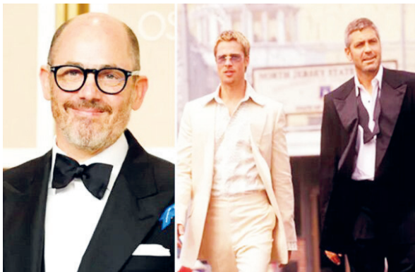
بیت به تازگی برای فیلم «گرگ‌ها» روی فرش قرمز جشنواره ونیز رفتند و با اقبال شادید رویره شدند.

قابلیت‌های بازیگری یی در او بود که توسط یکی از بازیگرشناس‌ترین فیلمسازان ایرانی انتخاب شد. دو نقشی که با شمایل همیشگی او در فیلم‌های اعتراضی یا اکشن تفاوت می‌کرد اما تبدیل به دو تازا بهترین و متفاوت‌ترین بازی‌های او شد. فرامرز قریببای تاکنون سه بار سیمرغ بلورین جشنواره فجر را همراه با چندین جایزه بین‌المللی به خانه برده است که آخرین شان برای بازی در فیلم «خروج» حاتمی کیا بود تا او پسین حضور سینمایی اش در مقام بازیگر با سیمرغ بهترین بازیگر نقش اول مرد پیوند بخورد. او در یک دوره‌ای از دهه ۶۰ و ۷۰ در کنار