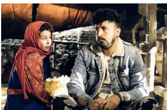
دستیار اول کارگردان: سعید بیات و...