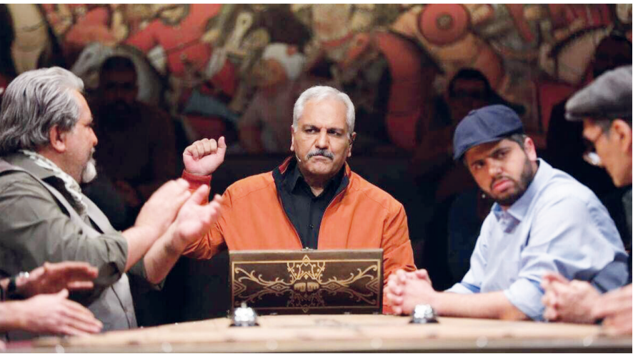
مخاطب رفته رفته احساس می‌کند که بازی گل یا پوچ از یک بازی مبتنی بر حدس و گمان و شانس برای او تبدیل به یک بازی نیازند تمرکز تجربه و هوش می‌شود. کار تیمی اهمیت پیدا می‌کند و تقاضای هر دو تیم برای یافتن گل، مخاطب را نیز با خود همراه می‌کند.

حالا بخشی از مخاطبان به نور کم صحنه و تاریکی بودن فضای مسابقه انتقاد داشتند. در نهایت بارزترین ویژگی گل یا پوچ، حضور درست و در چارچوب مهران مدیری به عنوان میزبان است. مدیری در اینجا برخلاف دوره‌هایی که تهیه‌کننده و اسکار که کارگردان را برعهده ندارد و تنها میزبان است. همین نشان‌گر این است که کنترل کردن او به عنوان میزبان، تا چه میزان از ورود بی‌مهابای او به مسابقه جلوگیری می‌کند و همین نکته به پیش برد بهتر این مسابقه نسبت به باقی برنامه‌های مدیری کمک کرده است.