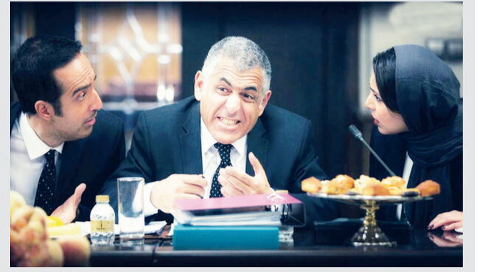
فرزانه متین - منتقد سینما