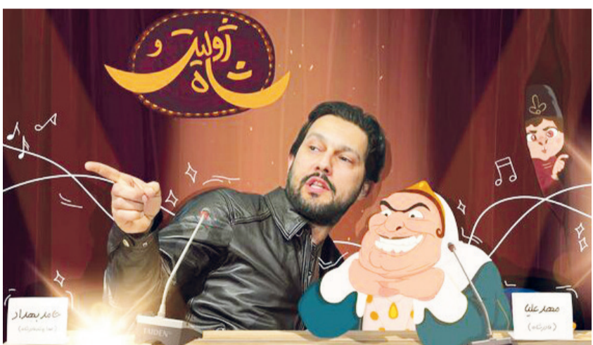
تجربه (Work in Progress) ۲۰۱۳ حضور داشته است. به مخاطبان معرفی شد. همچنین «ژولیت و شاه» در بخش انتقال بین المللی انیمیشن انسی ۲۰۲۲