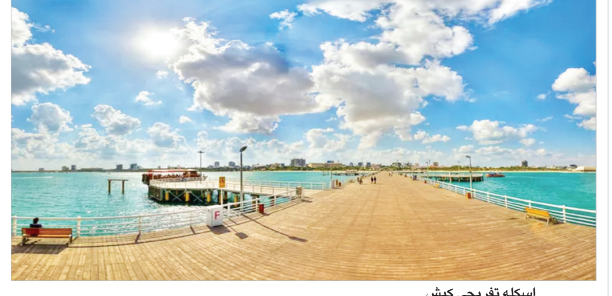
اسکله تفریحی کیش

آموزش آشپزی رولت با بیسکویت پتی بور و موز مواد لازم: بیسکویت پتی بور شکلاتی ۲ بسته شیر ۱/۳ پیمانه خامه صبحانه یک پاکت موز رسیده ۱ عدد گردو ۲ قاشق غذاخوری پودر قند ۲ قاشق غذاخوری کره ۳۰ گرم طرز تهیه: برای تهیه این دسر خوشمزه ابتدا باید بیسکویت های پتی بور را با کمک دستگاه یا بصورت دستی، کاملاً پودر کنید. به بیسکویت های پودر شده شیر و کره اضافه کرده و بخوبی مواد را با دست و رز پدید تا حالت خمیری پیدا