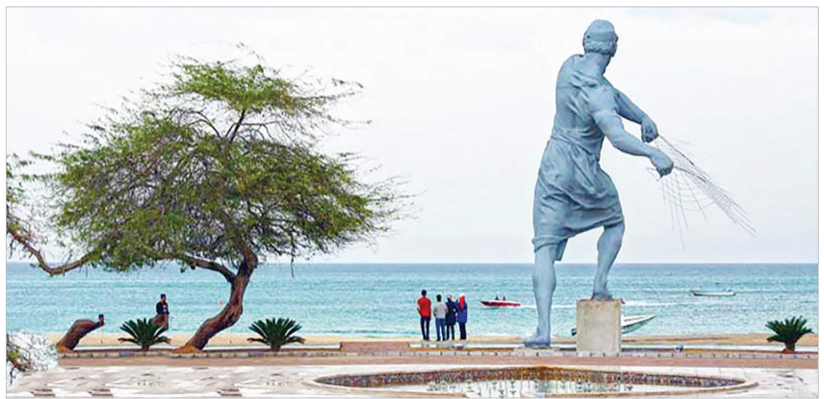
ساحل کیش - مرد ماهیگیر