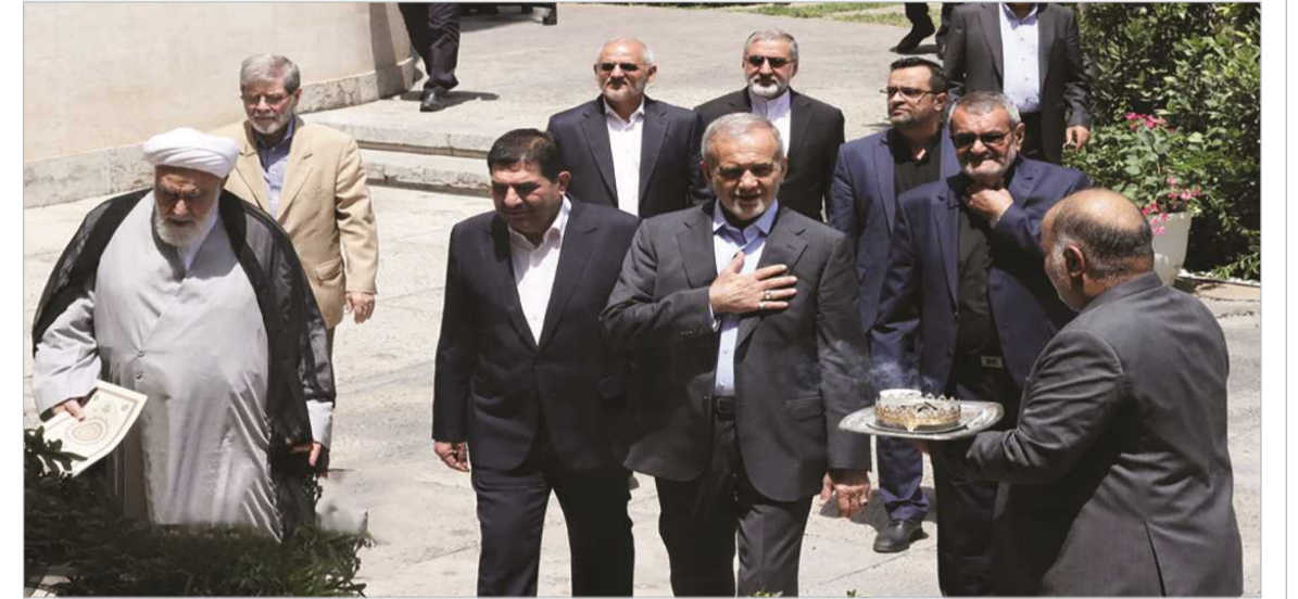
تحویل دفتر کار ریاست جمهوری به مسعود پزشکیان

سبک زندگی کلید آرامش در دنیای پرهیاهو چرب و شیرین نیز توصیه می‌شود. خواب کافی او گفت: خواب ناکافی می‌تواند استرس را تشدید کند. داشتن یک برنامه منظم خواب و ایجاد محیط خواب آرام و تاریک به بهبود کیفیت خواب کمک می‌کند. مدیریت زمان امیری بیان کرد: برنامه‌ریزی مؤثر و مدیریت زمان به کاهش استرس ناشی از کارهای ناتمام کمک می‌کند. تنظیم لیست کارها و وظایف می‌تواند مؤثر باشد. حمایت اجتماعی امیری بیان کرد: حفظ ارتباط با دوستان و خانواده و درخواست حمایت از آنها در مواقع نیاز می‌تواند به کاهش احساس تنهایی و استرس کمک کند. فعالیت‌های تفریحی او گفت: پرداختن به فعالیت‌هایی که به شما لذت می‌دهند، مانند خواندن کتاب، گوش دادن به موسیقی،