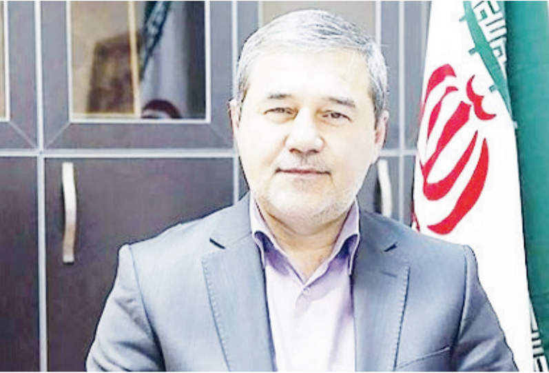
هیچ یک از اعضا، تعداد امتیاز داده شده به این ۵ نفر را نمی‌دانند. وی با تأکید بر اینکه این کمیته یک

رئیس کمیته معرفی وزیر میراث فرهنگی، گردشگری و صنایع دستی با بیان اینکه دخالت‌ها اثری در انتخاب ۱۵ فرد پیشنهادی نداشته است گفت: برخی افراد در چندین کمیته زنبیل گذاشته بودند و حالا ناراحتند.