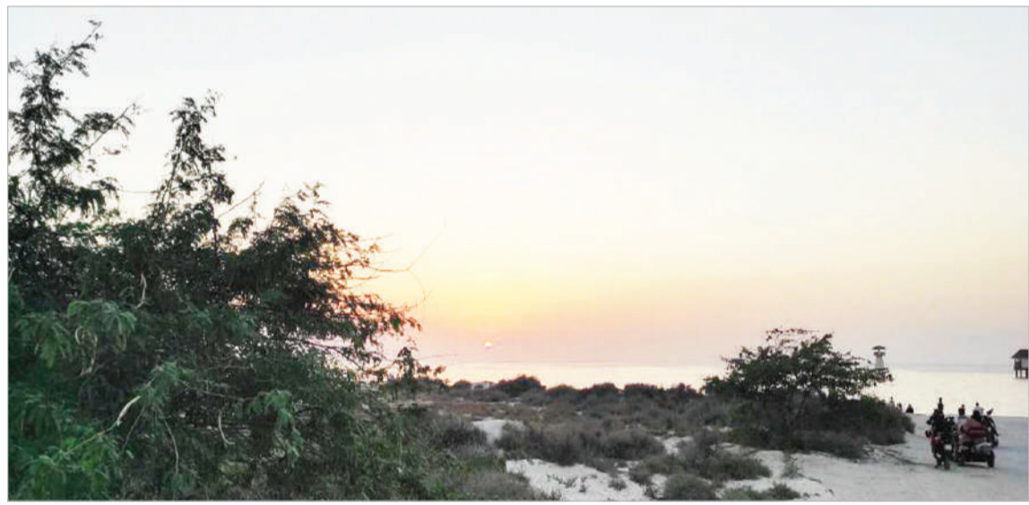
اشرف زابلی - کیشوند