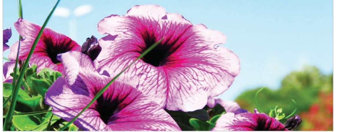
زیبایی های کیش - استاد کیومرث صیاد