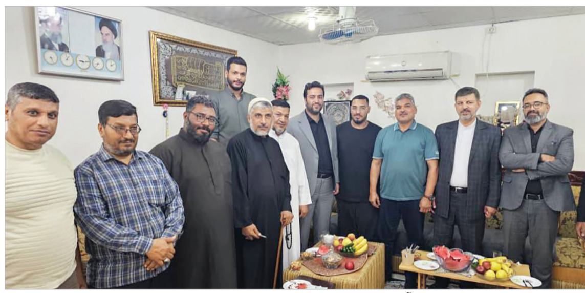
مدیر عامل سازمان منطقه آزاد کیش در جمع بومیان