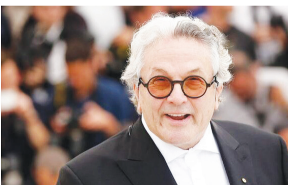
ایالات متحده اکران خواهد کرد؛ ۹ سال پس از آخرین قسمت قبلی این فرنچایز با نام «مکس دیوانه: جاده خشم» با ۱۰۰ میلیون دلاری به سودآورترین فیلم تمام دوران تبدیل شد.

گروه فرهنگ و هنر - نخستین نمایش جهانی فیلم «فیوریوسا: حماسه مکس دیوانه» در جشنواره کن با حضور عوامل و کارگردان با استقبال مخاطبان همراه شد. «فیوریوسا: حماسه مکس دیوانه» پنجمین قسمت از سری فیلم‌های مشهور ساخته «جورج میلر»؛ اولین نمایش جهانی خود را در جشنواره فیلم کن تجربه کرد و با تشویق ایستاده هفت دقیقه‌ای در سالن گرند لومیر کاخ جشنواره همراه شد، در حالی که کارگردان فیلم و ستارگان آن «آنیآ تیلور-جوی» و «گریس همسورث» روی فرش قرمز رفتند. «فیوریوسا» فیلمی ۱۶۸ میلیون دلاری که بسزادران وارنر در ۲۴ می در