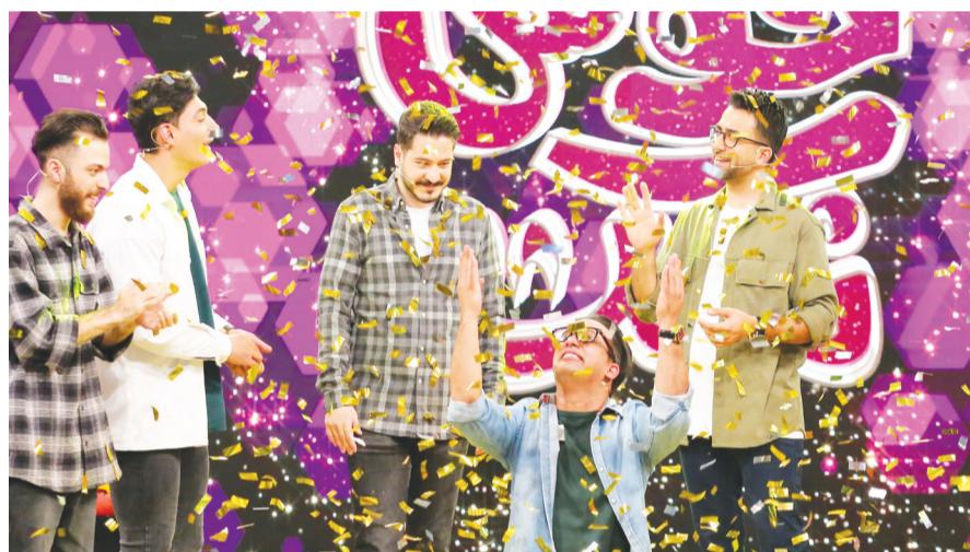
این تهیه‌کننده در ساره تعداد شرکت‌کنندگان گفت: در فصل جدید برنامه «خوش نمک» ۶۴ نفر به صورت گروهی به رقابت می‌کنند. شاید دهه‌های بالا نتوانند با طنز برنامه ارتباط برقرار کنند.