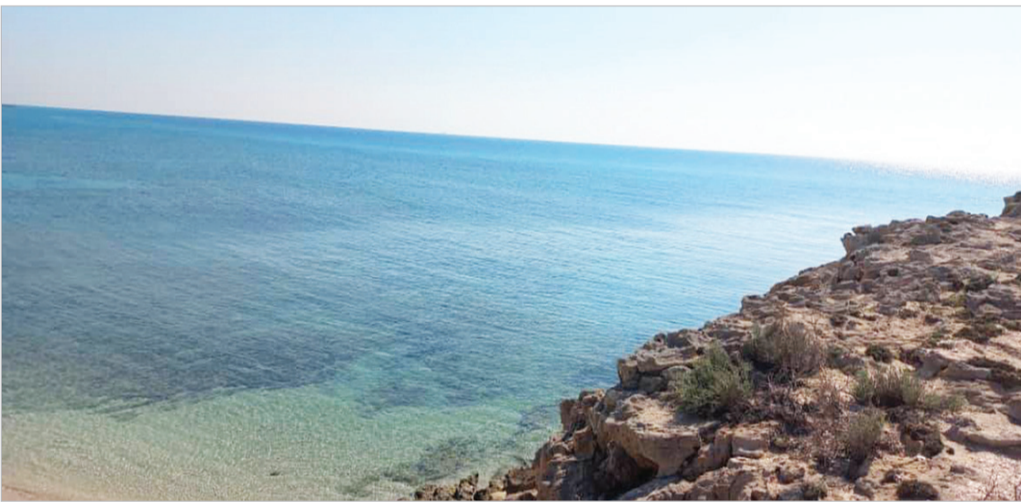
فرانک فتوحی - کیشوند