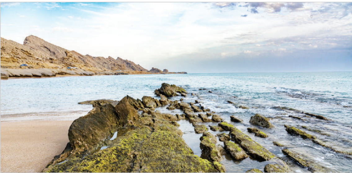
ساحل شگفت انگیز «دستیر» پارسیان - مهرداد صفرپور دهکردی