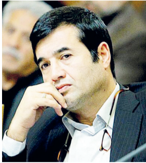
سرویس سیاسی – نماینده

مردم بندر انزلی در مجلس شسورای اسلامی با اشاره به عبور مردم از جریانات «اصولگرایی» و «اصلاح طلبی» به معنای آنچه پیشتر وجود داشته و اتخاذ رویکرد جدید در انتخابات اخیر گفت: امروز مجموعه‌هایی که حرف‌های نوب‌زند و در خصوص جریان حکم‌روایی ایده‌های جدید داشته باشند، مورد توجه قرار می‌گیرند.