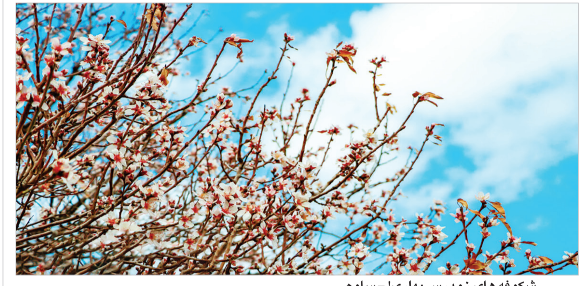
شکوفه های زودرس بهاری! - ساوه