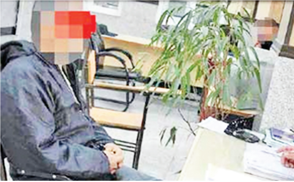
پس از ثبت اظهارات اولیه این متهم او به شعبه اول بازپرسی دادسرای امور جنایی تهران فرستاده شد و بازپرس اختیاری هم دستور بازداشت موقت او و انجام تحقیقات دقیق تر را صادر کرد.

می خوایدم، شب حادثه پسری که قرار بود با هم ازدواج کنیم آمد و سمت دیگر پشت بام خوابید. ناگهان مردی میانسال که او آشنا باینم بود به آنجا آمد و آنها با هم بدوایشان شد. موضوع این بود که چرا پسر جوان برای خوابیدن به پشت بام آمده است. آنها با هم درگیر شدند و مرد جوان که پسر مورد علاقه ام بود از پشت بام پایین افتاد و در خیابان فوت کرد. تحقیقات در این باره ادامه داشت و مرد میانسال به عنوان مظنون اصلی تا اینکه مرد میانسال به اداره دهم پلیس آگاهی تهران رفت و خود را تسلیم کرد. او در تحقیقات اولیه به کار آگاهان گفت: ۵۳ سال دارم و متاهل هستم، یک دختر نوجوان هم دارم. از ۲۴ سال پیش معتاد به تریاک، هروین و شیشه شدم. مدت ها بود که در خوابگاه می می خوابم به عنوان خدمتکار کار می کردم. شب ها هم گاهی آنجا می ماندم، اما بعد از مدتی چون خدمتکارها زیاد شدند مجبور شدم، جاهای دیگری