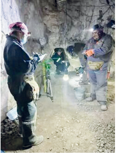
گروه گردشگری - باستان‌شناسان گور ۲۵۰۰ ساله‌ای که در غاری واقع در مکزیک کشف کردند.