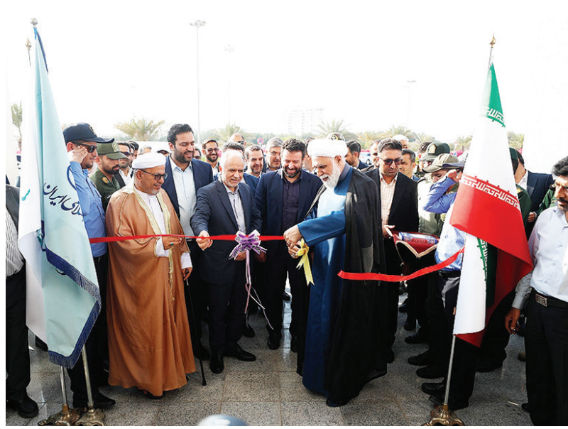
پروژه تهیه مصالح و اجرای عملیات احداث ساختمان دادگستری کیش در دی ۱۳۹۸ توسط سازمان منطقه آزاد کیش آغاز و تکمیل ۶۰ درصد پروژه در دولت سیزدهم محقق شده است.

اقتصاد کیش - با حضور وزیر دادگستری، معاون قوه قضاییه و مدیر عامل سازمان منطقه آزاد کیش ساختمان جدید دادگستری کیش با عملیات اجرایی و اعتبار اهدایی سازمان منطقه آزاد کیش و به بهره برداری رسید.