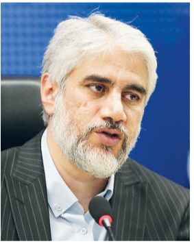
احمدوند معاون فرهنگی وزیر فرهنگ و ارشاد اسلامی:

نواوری در محصولات و کالاهای فرهنگی یکی از بنیادی‌ترین نیازهای جامعه معاصر ایران است، نگاهی هرچند گذرا به محصولات فرهنگی در ساخت فرهنگ با کارکردهای صنعتی همچون تولید و تجاری‌سازی انبوه کالاهای فرهنگی است. نواوری در محصولات و کالاهای فرهنگی یکی از بنیادی‌ترین نیازهای جامعه معاصر ایران است، نگاهی هرچند گذرا به محصولات فرهنگی در ساخت فرهنگ با کارکردهای صنعتی همچون تولید و تجاری‌سازی انبوه کالاهای فرهنگی است. نواوری در محصولات و کالاهای فرهنگی یکی از بنیادی‌ترین نیازهای جامعه معاصر ایران است، نگاهی هرچند گذرا به محصولات فرهنگی در ساخت فرهنگ با کارکردهای صنعتی همچون تولید و تجاری‌سازی انبوه کالاهای فرهنگی است. نواوری در محصولات و کالاهای فرهنگی یکی از بنیادی‌ترین نیازهای جامعه معاصر ایران است، نگاهی هرچند گذرا به محصولات فرهنگی در ساخت فرهنگ با کارکردهای صنعتی همچون تولید و تجاری‌سازی انبوه کالاهای فرهنگی است.