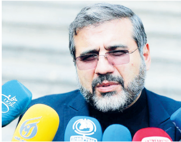
وزیر فرهنگ و ارشاد اسلامی خبر داد: