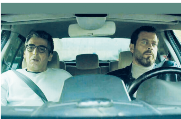
کرد کشور می پرداخت. او همچنین کارگردانی مجموعه‌های «نوار زرد»