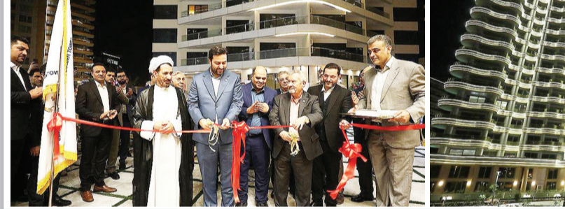
مدیر عامل بانک صنعت و معدن کشور خبر داد:

مجموعه برج های طلایی کیش با امکانات رفاهی هم چون: استخر، سونای خشک و بخار، سالن بدنسازی، لابی مجلل، زمین تنیس، آبنمای موزیکال، تالار بازی موجب شده است مجموعه ای فاخر با عنوان شهر طلایی کیش در این بخش از جزیره شکل بگیرد.