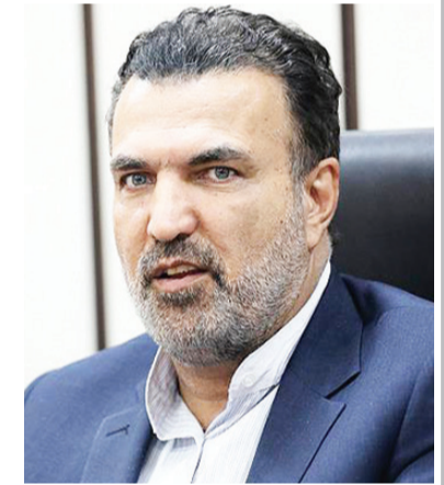
رئیس فدراسیون والیبال جهت همکاری دو جانبه با جزیره کیش روز گذشته جلسه‌ای