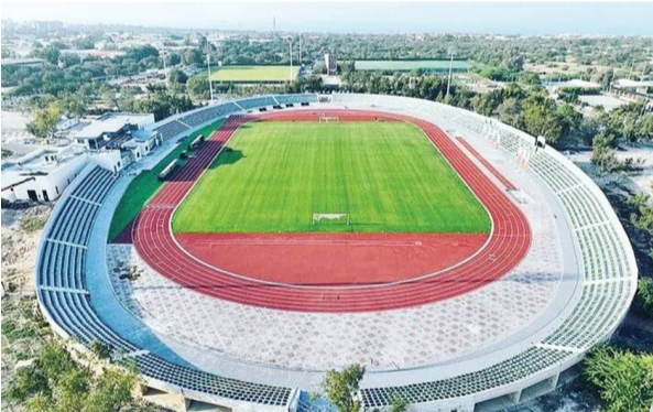
تأیید، سایر کارهای میزبانی استقلال در کیش پیگیری شود.

اقتصاد کیش - در حالی که پیش از این مدیرعامل باشگاه استقلال میزبانی از حریفان در جزیره کیش را مشروط اعلام کرده بود اما به نظر می‌رسد انتقال دیدارهای آبی پوشان به این جزیره در حال قطعی شدن باشد.