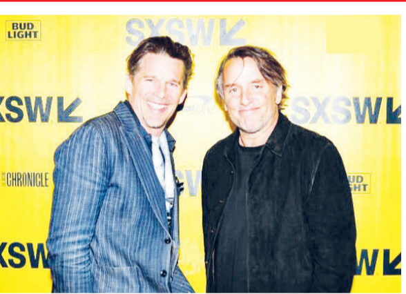
ایتن هاوک بازیگر و فیلمساز نامزد دریافت ۴ جایزه اسکار و یک جایزه تونی بوده‌است. او سه فیلم بلند، سه نمایشنامه خارج از برادوی و یک مستند کارگردانی کرده و خالق ۳ رمان و یک رمان گرافیکی است. سابقه همکاری هاوک و لینک‌لیتر طولانی است. وی در سه‌گانه «پیش

از طلوع» (۱۹۹۵)، «پیش از غروب» (۲۰۰۴) و «پیش از نیمه‌شب» (۲۰۱۳) لینک‌لیتر ایفای نقش کرد و برای نوشتن فیلمنامه فیلم دوم نامزدی اسکار را به دست آورد. وی بازیگر «پسر بیگانه» (۲۰۱۴) ریچارد لینک‌لیتر هم بود که برای آن هم نامزد دریافت جایزه اسکار شد. «پسران نیوتن» محصول انیمیشن «زندگی بیداری» محصول ۲۰۰۱، «نوار» فیلم نرئو محصول ۲۰۰۱، «ملت فست فودی» محصول ۲۰۰۶ فیلم‌هایی هستند که لینک‌لیتر ساخته و ایتن هاوک بازیگرش بوده است. «بلیز» به کارگردانی ایتن هاوک با بازی هاوک و لینک‌لیتر محصول ۲۰۱۸ هم یک همکاری دیگر آن ۲ را رقم زد.