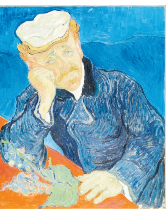
گروه فرهنگ و هنر- مسوولان موزه «اورسی» نمایشگاهی را ترتیب

داده‌اند که دو ماه پایانی زندگی «ون‌گوگ» را در مرکز توجه قرار می‌دهد و آخرین آثار هنری این هنرمند هلندی را در مرکز توجه قرار می‌دهد. امسال با صد و هفتادمین سالگرد تولد «ویسنست و نگوگ» مصادف است و دو ماه پایانی زندگی این هنرمند به موضوعی برای نمایشگاه بزرگی در موزه «اورسی» واقع در پاریس تبدیل شده است. این نمایشگاه که با همکاری «موزه ون‌گوگ» در آمستردام برگزار شده است، «ون‌گوگ» در آور سور ماه‌های پایانی» نام دارد و در مجموع ۴۸ نقاشی از ۷۴ تابلو نقاشی و ۲۵ طراحی از ۳۳ طراحی که این نقاش پست امپرسیونیست در فاصله بیستم مه ۱۸۹۰ تا زمان مرگش در بیست و نهم جولای خلق کرده است را جمع‌آوری کرده است. بسیاری از این نقاشی‌ها برای