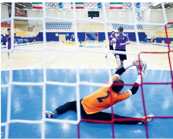
مسابقات از تاریخ ۲۷ آبانماه بمدت ۵ روز برگزار می‌گردد و دو تیم کارگران کشور صعود خواهند کرد.

رئیس انجمن فوتسال کارگری منطقه آزاد کیش اعلام کرد: این