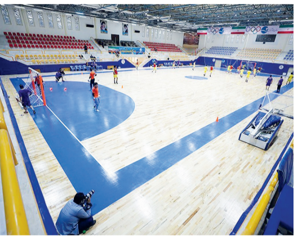
نیز در این مسابقات حضور خواهد یافت.