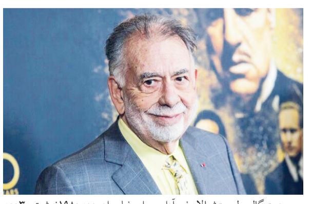
تار و تاریخ می‌شنوید و می‌بینید کاملاً مستقل تولید و ارائه شده و خواهد شد. در پایان امبدوارم این دستاورد حتی برای چند ثانیه باعث ایجاد لیختن روی لیلتان شود که هیچ مقام و مرتبه و جایزه‌ای به اندازه لیختن لیختن شما برایم مهم نیست.