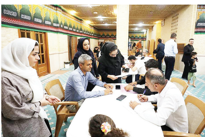
کیش شناسایی می‌شود تا نقاط ضعف و قوت دستگاه‌های مستقر در کیش شناسایی شود.

اقتصاد کیش - سازمان منطقه آزاد کیش همراه با شرکت‌های بزرگ جهانی در نمایشگاه سیفت ۲۰۲۳ چین، دستاوردها، بسته‌ها و فرصت‌های سرمایه‌گذاری و صادرات خود را ارائه می‌دهد.