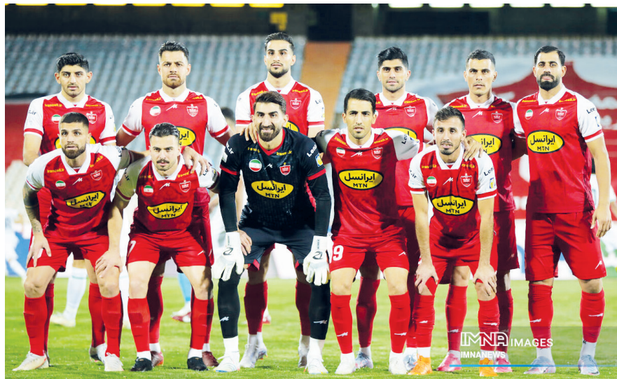
گروه ورزشی - سپاهان و پرسپولیس که هر دو در این هفته پیروزی‌های خنجر از خانه مهمی کسب کردند، بیشترین سهمیه را در بین برترین های هفته داشتند. به نظر می‌رسد کورس نزدیک دو

دو مدعی اصلی قهرمانی بیشترین سهم را در بین ترین های هفته چهارم لیگ برتر داشتند.