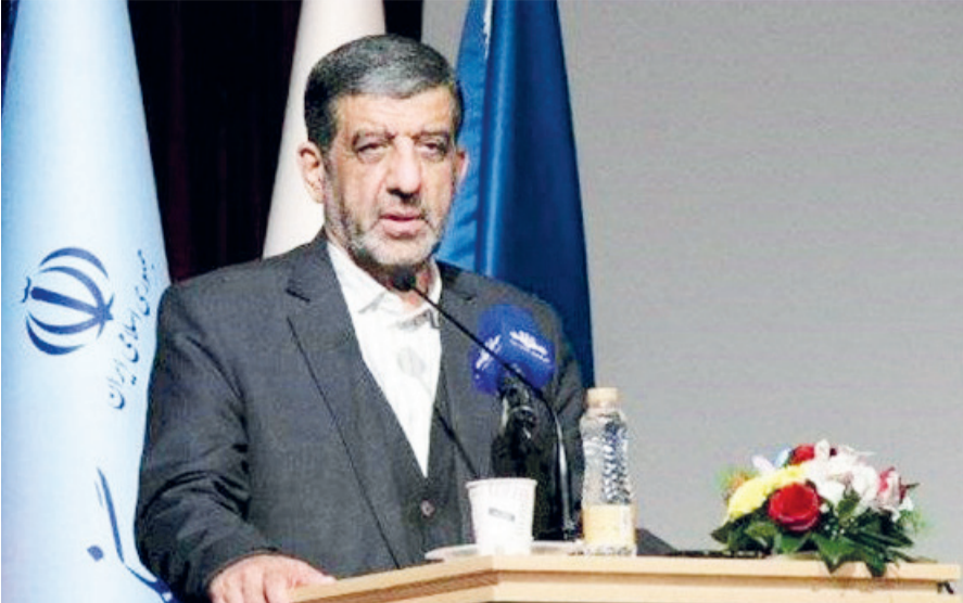
توطه‌های بدخواهان خنثی و با شکست مواجه شده است. ضرغامی که بسا توجه به اینکه کردستان از همه ظرفیت‌های

وزیر میراث داشت: همه جای ایران دیدنی و مقصد گردشگری و ظرفیت جاذبه‌های طبیعی را دارد، اما کردستان، یک استان استثنایی و به خاطر موقعیت مرزی می‌تواند برای کشور درآمزی و توسعه به دنبال داشته باشد.