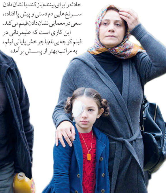
معنایی جلوه دادن فیلم شروع فیلم ستاره بازی، حضور صبا و دوستش در یک مهمانی در شب هالووین را نشان می دهد که بیانگر فضای داستان و شخصیت صبا است. همینطور اعتیاد او به مواد مخدر، صبا را از دختری آرام به دختری سرکش تبدیل کرده است. شبی که در نهایت منجر به حادثه های وحشتناک شده و بعد از آن شب، او را به مطب روانشناسش می کشاند تا اقرار کند که کار بدی کرده است و تا اواسط فیلم بدون اینکه ابعاد حادثه را برآی بیننده باز کند، نشان دادن سر نخ های دم دستی و پیش پا افتاده، سعی در معمای نشان دادن فیلم می کند. این کاری است که علیمردانی در فیلم کوچه بی نام با چرخش پایانی فیلم، به مراتب بهتر از پیشش برآمده

یک خانواده مهاجر فیلم ستاره بازی در واقع حکایت واقعی زندگی دختری بیست ساله است که با پدر و مادر خود در کودکی به واسطه ی برنده شدن در لاتاری به امریکا مهاجرت کرده است. او از همان کودکی با یک بیماری چشمی مواجه بوده که با چند عمل جراحی و تجربه ی نابینایی برای چند سال در کودکی،