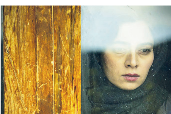
۱۴ تا ۱۸ شهریور (پنجم تا نهم سپتامبر) برگزار می شود، با آثاری

از سینمای کشورهای روسیه، یونان، مراکش، ترکیه، هند، تاجیکستان و سوریه به رقابت بپردازد. این فیلم که پیش تر نیز حضوری موفق در فستیوال های بین المللی داشته است، اوایل سال جاری در دو جشنواره «آرکتیک» و «دروازه های غرب» که هر دو در کشور روسیه برگزار شدند بسیارخوش درخشیده است.