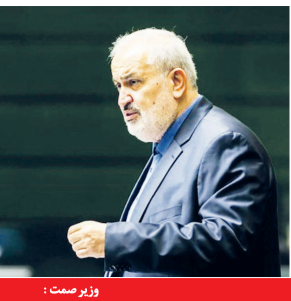
وزیر صمت ؛

رانشان می دهد یعنی ما به سمت این می رویم که مطابق استانداردهای روز دنیا تولید داشته باشیم. وزیر صمت بیان داشت: اتومبیل های سبز اقتصادی می توانند مصرف بنزین را تا ۴ لیتر کاهش دهند، اما مصرف اتومبیل های بزرگتر خودرو را به صورت غیر قابل باوری، صعودی کنند. اما به جهت تهیه خودرو توسط مصرف کننده و آف صنایع نیز گفت: در استان هایی مثل سمنان باید بهره وری را بالا ببریم یکی از کارهای که صنایع آماده هستند به متناسب با نیاز و تقاضا استاندارد چهارم جهانی برای افزایش بهره وری در مصرف آب کشاورزی است و این آب صرفه جویی شده را به صنایع اختصاص دهیم. ضمن اینکه باتوجه به اینکه استان صنعتی است سهم بیشتری از آب را به صنایع اختصاص دهیم.